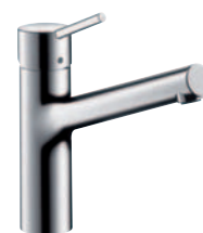
Talis® S Einhebel Küchenmischer # 32851000 für offene Heißwasserbereiter # 32852000 mit Geräteabsperrentil # 32855000 (o. Abb.)