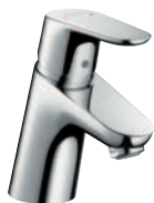
Focus® E 2 Einhebel-Waschtischmischer # 31730000