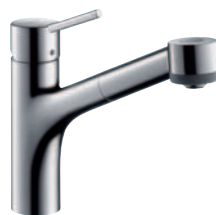
Talis® S Einhebel-Küchenmischer mit Ausziehbrause # 32841000 für offene Heißwasserbereiter # 32842000