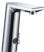
Metris® S Elektronik-Waschtischmischer Batteriebetrieb 6V # 31100000 Netzbetrieb # 31102000 (o. Abb.)