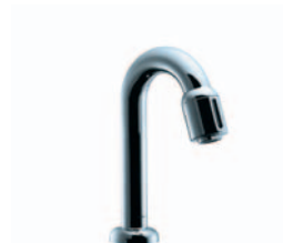
Standventil # 13130000