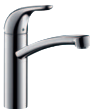
Focus® E Einhebel-Küchenmischer # 31780000 für offene Heißwasserbereiter # 31784000