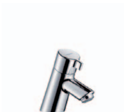
Talis® S Standventil # 13132000