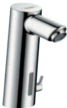
Talis® S 2 Elektronik-Waschtischmischer Batteriebetrieb 6V # 32110000 Netzbetrieb # 32112000 (o. Abb.)