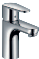
Talis® E 2 Waschtischmischer # 31612000 für offene Heißwasserbereiter # 31616000